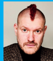
Sascha Lobo/ Kolumnist, Digital- experte, Blogger