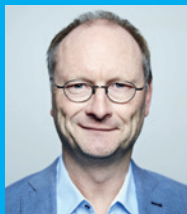
Sven Plöger/ Dipl.-Meteorologe

14.30 Uhr Führung Schloss & Humboldt Forum - 16.00 Uhr mit Hans-Dieter Hegner