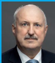
Hans-Dieter Hegner/ Stiftung Humboldt Forum