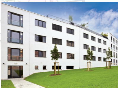
Bilder: Regnauer Fertigbau

Neu entwickelte Haustypologien für den sozialen Wohnungsbau realisieren unterschiedliche Grundrissvarianten für Modulbauweise oder Elementbauweise, die auch das äußere Erscheinungsbild prägen.